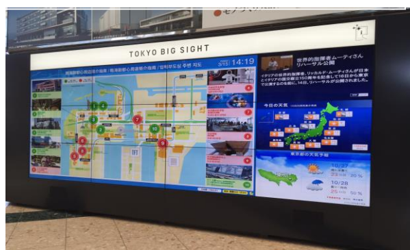
※世界首个利用“光 ID”的出入口大厅数字标牌 ※开发·销售商：Panasonic System Networks（株）